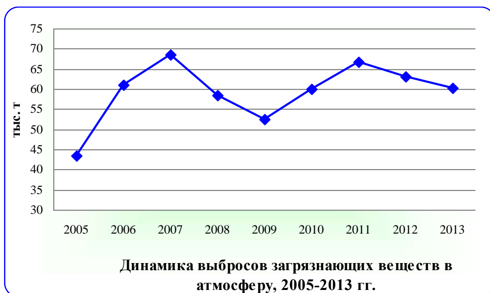
Р и с. 1. Динамика выбросов ЗВ в 2005-2013 гг. в Тверской области (Государственный доклад..., 2013)

За последние пять лет с 2009 по 2013 годы средние концентрации меди повысились. Уровень загрязнения атмосферы взвешенными веществами, оксидом углерода, диоксидом азота, оксидом азота, бенз(а)пиреном, никелем, хромом, железом, марганцем, цинком снизился. Без изменения остался уровень загрязнения атмосферы диоксидом серы, формальдегидом.