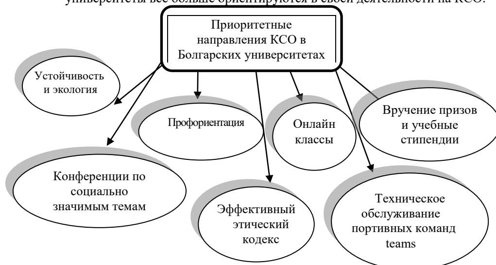
Р и с . 2. Основные приоритетные направления SCR в болгарских университетах

- университеты все больше ориентируются в своей деятельности на КСО.