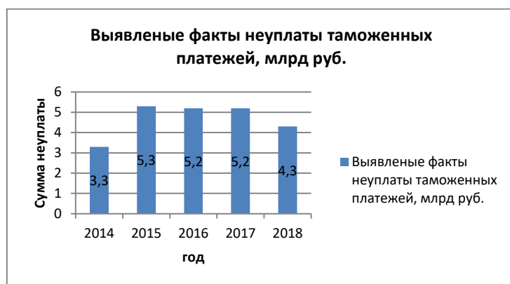
Рис. 2 Выявленные факты неуплаты таможенных платежей

Доказывание по делам о преступлениях, связанных с уклонением от уплаты таможенных платежей, имеет ряд особенностей, обусловленных, во-первых, объектом и предметом преступного посягательства; во-вторых, характеристикой субъекта преступления; в-третьих, спецификой объективной стороны вышеназванного преступного посягательства.