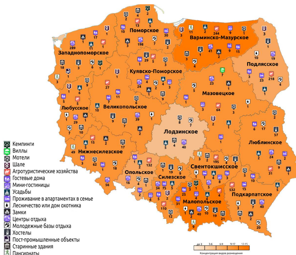
Р и с. 2. Виды проживания сельских туристов в Польше (1.01.2020 г.) [5]

Из всех видов размещения выделяются агротуристические хозяйства (их 1090), они есть почти в каждом воеводстве, за исключением Лодзинского. Значимость агротуристических хозяйств велика, так как многие фермы, которые находились на пороге банкротства, восстанавливали свое хозяйство как раз при помощи сельского туризма, организуя на своих фермах ночлег и досуг для туриста.