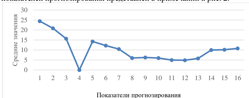
Рис. 2. Средние значения показателей прогнозирования нормотипичных детей дошкольного возраста: 1 – навык прогнозирования действий; 2 – навык прогнозирования высказываний; 3 – навык прогнозирования эмоций; 4 – невербальный прогноз; 5 – регулятивная функция прогнозирования; 6 – когнитивная функция прогнозирования; 7 – речекommunikативная функция прогнозирования; 8 – сфера взаимоотношений «ребёнок – родитель» в ситуациях, организованных взрослым; 9 – сфера взаимоотношений «ребёнок – взрослый» в ситуациях, организованных взрослым; 9 – сфера взаимоотношений «ребёнок – ребёнок» в ситуациях, организованных взрослым; 10 – сфера взаимоотношений «ребёнок – родитель» в спонтанно возникших ситуациях; 11 – сфера взаимоотношений «ребёнок – взрослый» в спонтанно возникших ситуациях; 11 – сфера взаимоотношений «ребёнок – ребёнок» в спонтанно возникших ситуациях; 12 – сфера взаимоотношений «ребёнок – родитель» в организованных взрослым и спонтанно возникших ситуациях; 13 – сфера взаимоотношений «ребёнок – взрослый» в организованных взрослым и спонтанно возникших ситуациях; 14 – сфера взаимоотношений «ребёнок – ребёнок» в организованных взрослым и спонтанно возникших ситуациях; 15 – сфера взаимоотношений «ребёнок – взрослый» в организованных взрослым и спонтанно возникших ситуациях; 16 – сфера взаимоотношений «ребёнок – ребёнок» в организованных взрослым и спонтанно возникших ситуациях.

С целью изучения специфики взаимосвязи показателей прогнозирования как ведущего показателя социализации детей дошкольного возраста (рис. 2) и социализации (табл. 2) были выявлены средние значения по групповым показателям. Перечень исследуемых показателей прогнозирования представлен в примечании к рис. 2.