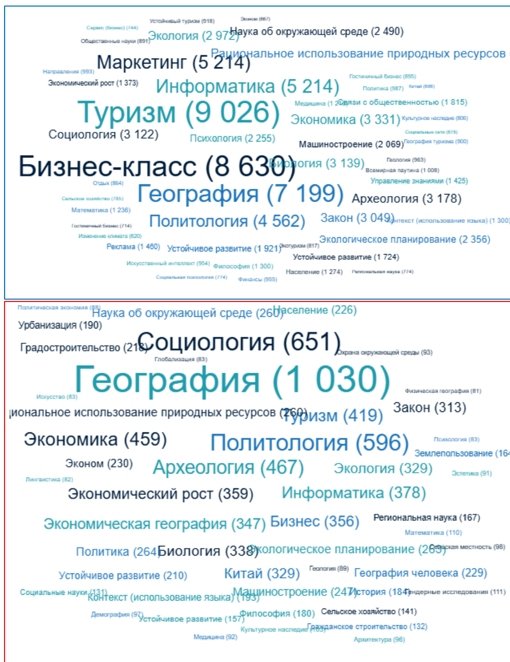
Рис. 1. Междисциплинарные исследования туризм как инструмента управления: разные варианты формулировок запроса*

*Запросы даны с разными формулировками. В итоге наиболее интересные публикации по вопросам управления городским