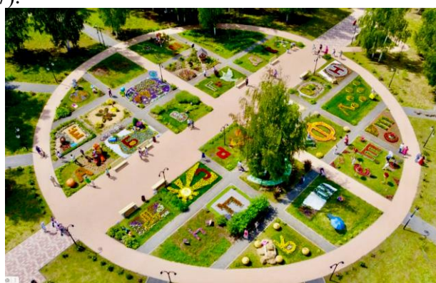
Рис.6. Площадка проведения фестиваля «Вальс цветов» в городе Клин.

• Принцип «привлечения»: расширение потока местных жителей (и гостей) и увеличение времени пребывания людей вне «дома» в периоды проведения ярмарок, фестивалей и других мероприятий, которые организованы в специализированных общественных пространствах. Пример: ландшафтно-парковый проект, успешно реализованный на территории городского округа Клин, под названием «Вальс цветов». Данный парк является местом проведения досуга местных жителей и гостей города, а также местом проведения одноименного ежегодного фестиваля флористики и дизайна «Вальс цветов» (рис.7).