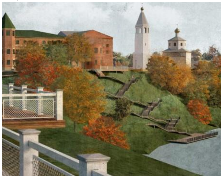
Рис. 3. Клин, прибрежная территория р. Сестра: спуск к реке, смотровые площадки. Проект в процессе реализации. Фрагмент: https://mirrorgroup.ru/wp-content/uploads/2022/06/7.-Papivina.jpg .

• Улица как пространственный элемент города, его трансформация для культурного туризма города. Пример города Клин (Московская область): проект пешеходной улицы через весь город как линейный транспортный (пешеходный) каркас города, который должен включить ядро музыкального кластера города – дом-музей П.И. Чайковского. См. проект: Пешеходная зона ул. Чайковского г. Клин – благоустройство пешеходных зон города. М.: Архитектурная мастерская Mirror Group, 2020–2021 гг. URL: https://mirrorgroup.ru/14-klin/ [5]. При разработке проекта многофункциональной пешеходной зоны в городе Клин использован принцип разноуровневого пространства : площадки на разном уровне в виде декоративного пешеходного моста, который переходит в амфитеатр со сценой в начале и обзорной смотровой площадкой в конце маршрута (рис.3). Природное пространство с элементами детской игровой зоны также будет в виде холмов геопластики 1 .