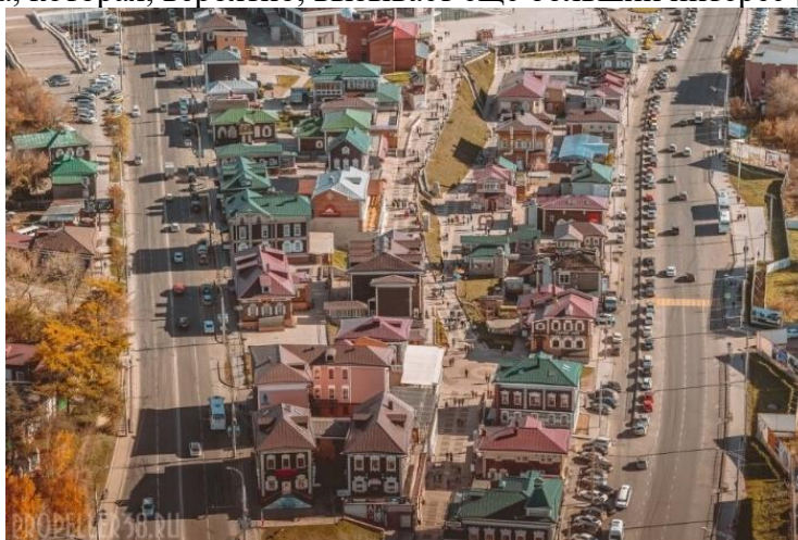
Рис.2. «Квартал 130» в Иркутске: старый жилой квартал деревянной застройки превращён в торгово-развлекательный туристский центр (без жилья и деловых функций).

• Пример « Квартал 130 » в Иркутске: старый жилой квартал деревянной застройки превращён в торгово-развлекательный туристский центр (без жилья и деловых функций) – см. фотографии (рис.2). План реконструкции старого города как часть генплана города=управленческий инструмент. Много негативных комментариев на данный проект в центре города (главная ошибка – здесь больше не живут люди). На фотографии хорошо видно, что в непосредственном соседстве с «туристским городком/зоной» – старая деревянная жилая застройка, которая, вероятно, вызывает еще больший интерес [9].