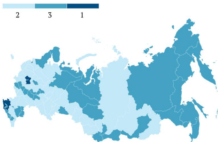
Рис. 3. Типология регионов РФ по уровню развития туристско-рекреационных систем по состоянию на 2023 г.

Кластер 1 – «Абсолютные лидеры» отражает принципиально новую группу, объединившую четыре субъекта: Москву, Санкт-Петербург, Московскую и Краснодарскую области. Данные регионы демонстрируют максимальные значения по всем анализируемым показателям, существенно дистанцировавшись от остальных субъектов РФ по плотности туристской инфраструктуры, объёму туристского потока и развитию культурного потенциала.