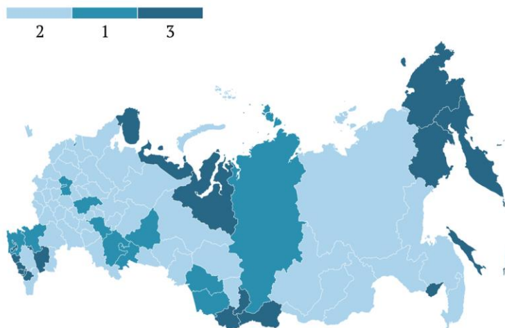
Рис. 2. Типология регионов РФ по уровню развития туристско-рекреационных систем по состоянию на 2019 г.

Кластер 1 – «Крупные туристско-экономические центры». Данная группа объединила ключевые субъекты РФ – Москву, Санкт-Петербург, Московскую область, Краснодарский край, а также крупные региональные центры (Ростовская область, Республика Татарстан, Нижегородская область и другие). Регионы кластера демонстрировали максимальные значения по большинству анализируемых показателей, выступая локомотивами развития туристической индустрии и обладая наиболее развитой инфраструктурой.