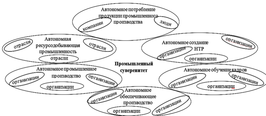
Рис. 2. Модель универсального компонентно-элементного состава промышленного суверенитета

На рис. 2 представлены отрасли, компании и фирмы, а также предприятия и учреждения, составляющие компоненты промышленного суверенитета и непосредственно реализующие основной его компонентный процесс.