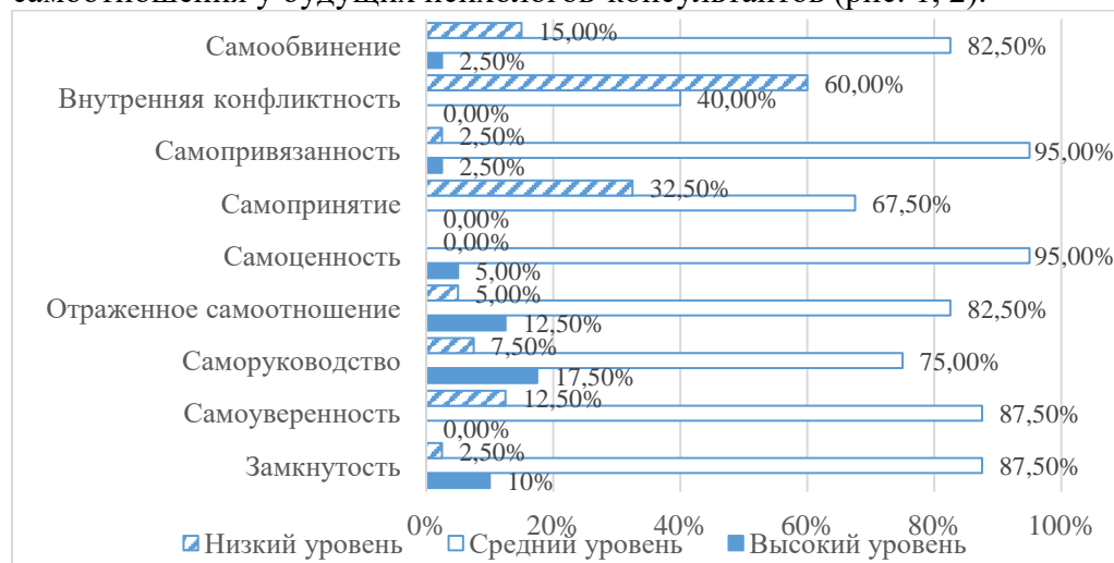
Рис. 1. Процентное распределение будущих психологов мужского пола по уровню самооотношения

В соответствии с гендерной принадлежностью, определялась частота встречаемости высоких, средних и низких показателей особенностей самооотношения у будущих психологов-консультантов (рис. 1, 2).